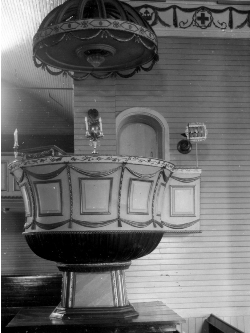
Kustaa Aadolfin kirkon saarnastuoli. Satakunnan Museo SMK1292, valokuvaaja tuntematon.