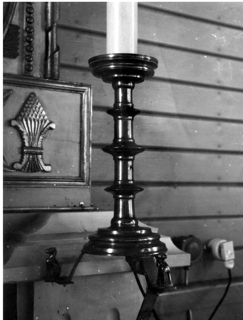
Kynttilänjalka Kustaa Aadolfin kirkon alttarilla. Satakunnan museo.