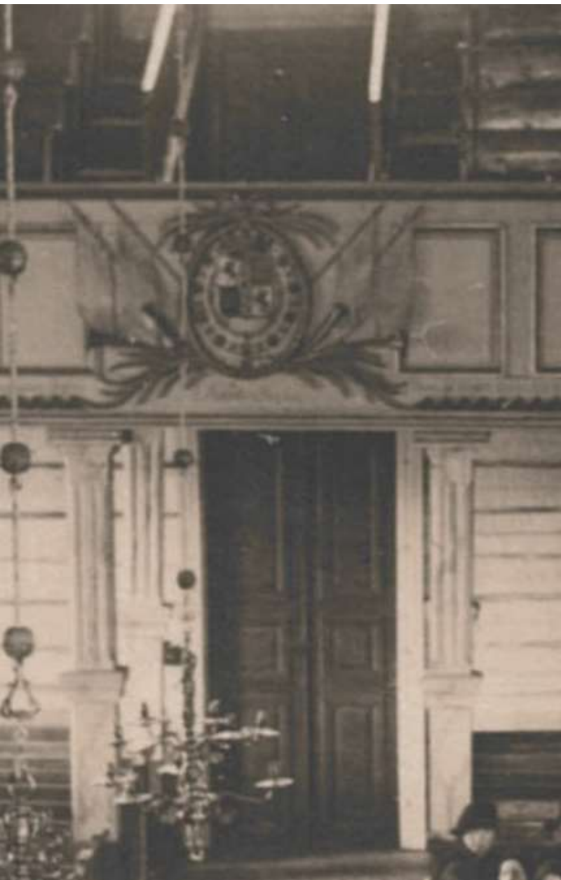
Vasemmallla: Kuva pohjoiseen ennen vuotta 1925; parven alla oleva alkupe- räinen ovi oli nykyistä ovea korkeampi ja yhte- näinen. Tässä pilarit oli- vat marmoroidut jo en- nen 1925 muutoksia. Oi- kealla valokuva vuodelta 1978, jossa seinäpinnat ovat vielä ilmeisesti 1964 maalatussa asussa, ilmei- sesti tässä vaiheessa myös pilarien ooteraus on jo peitetty uudella, yksi- värisellä maalikerroksella.