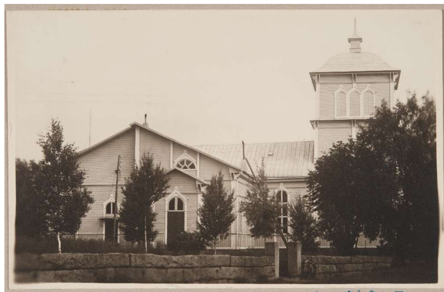
1910-luku