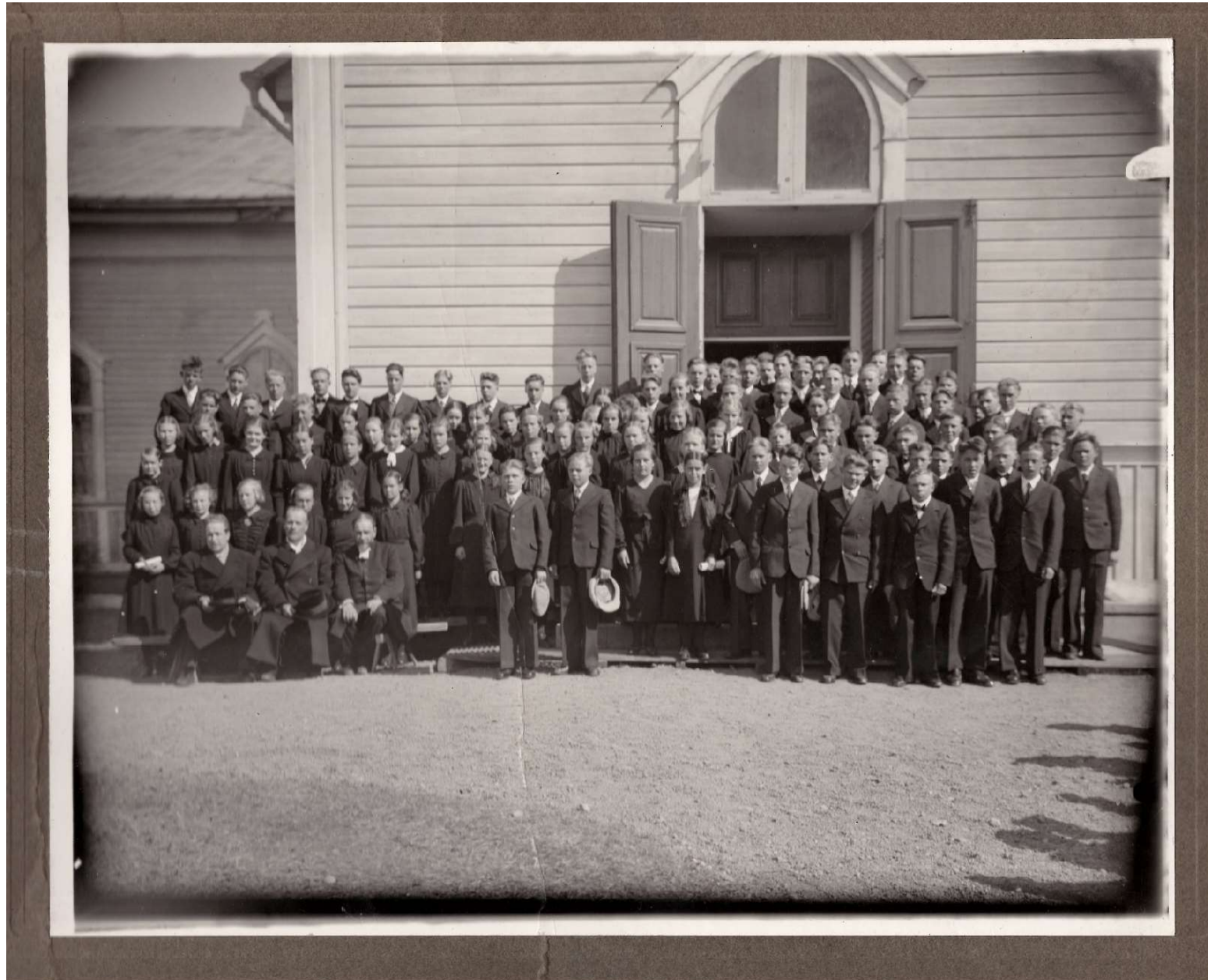
Kuvan ajoituksesta ei ole varmaa tietoa, mutta se lienee 1900-luvun alkupuolelta.