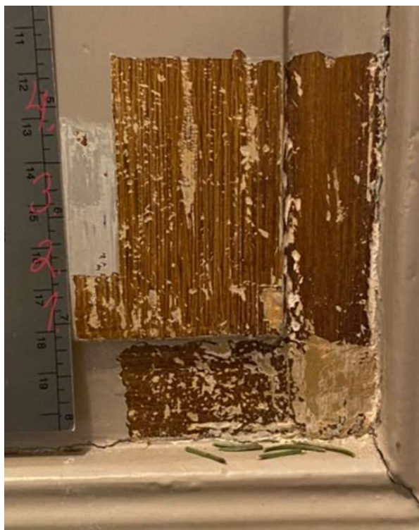
Vasemmallä: Pohjoisen parven alla olevan ovilehden värikerrokset. Kuva Jaana Finnberg/Verstas 2, Eurajoen Kustaa aadolfin kirkon sisätilojen väritutkimus 2024.

Ikkunoiden osalta ei tarkempaa tarkastelua päästä tekemään, sillä ne on vaihdettu jälleen 1988 tehdyn laajan peruskorjauksen yhteydessä, 85 eikä vaihdettuja ikkunoita tiettävästi säilytetty. Ovien osalta tuntuu erikoiselta, että ne olisi vaihdettu vasta 1925 ja käsittelyksi valittu ooteraus, kun pylväiden ooterauskerros on marmoroinnin alla.