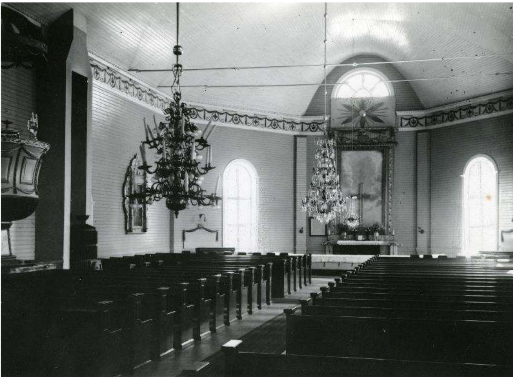
Valokuva Kustaa Aadolfin kirkon alttarialueelle. Vasemmanpuoleisella seinällä, hieman kattokruunun taakse piiloon jääneenä, vanhan kirkon alttaritaulu sakaristosta kirkkosaliin tuotuna.