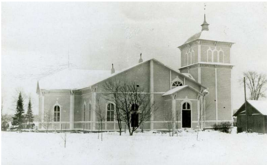
Kirkko kuvattuna pohjoisesta: Seurakuntain keskinäinen palovakuutusyhtiö 1930.

1930- 40- ja 50-luvuilta ei ole tiedossa merkittäviä muutoksia. Tämä onkin luonnollisesti selitettävissä ensin sotaa kohti menevällä ajalla, sotavuosilla ja toisaalta vielä sodasta toipumiseen tarvitulla vuosikymmenellä. Seuraavat suuremmat muutokset tulivat ajankohtaisiksi vasta 1960-luvulla.