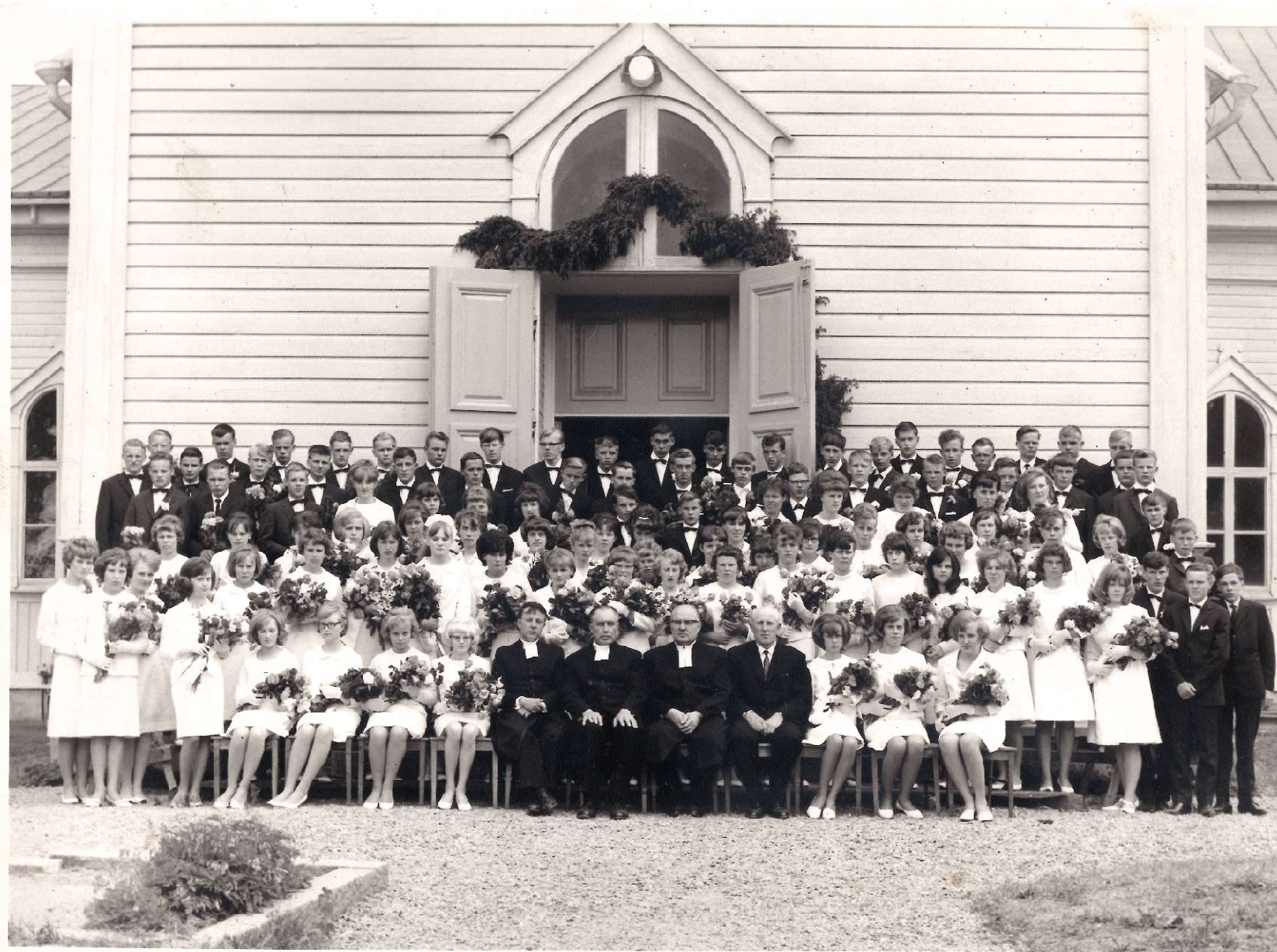
Valokuva otettu ilmeisesti 1950- ja 60-lukujen taitteessa. Pääoven yllä ei vielä ole katosta.