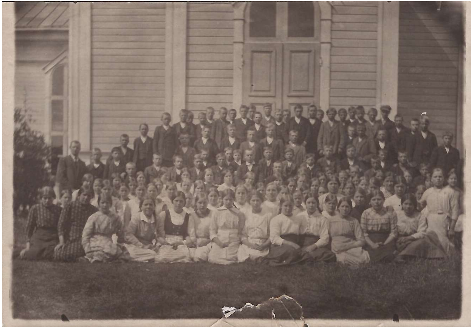
Kuvan ajoituksesta ei ole varmaa tietoa, mutta se lienee 1900-luvun alkupuolelta. Kuvassa ovat kirkon alkuperäiset ikkunat ja ovet. Ne vaihdettiin 1925 ja toistamiseen 1988. Julkisivulauta on säilynyt tähän päivään.