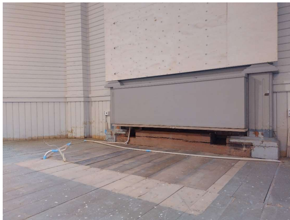
Altтарin edustalla on myös suorakulmainen alue maalaamatonta lautta, sekä hieman laajempi suorakulmio vaalealla umbralla maalattua lautta. Tässä kohtaa on mahdollisesti ollut myöhemmin laajennettu koroke, jolla pappi on seissyt altтарin edessä ollessaan.

Alin maalikerros nykyisessä lattialaudassa on ruskea.