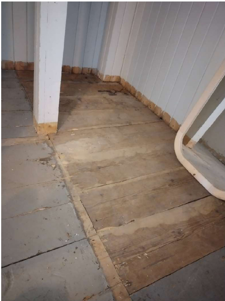
Pohjoisen parven portaikon alla on säilynyt muutamia leveitä, maalaamattomia lautoja.

Kirkkosalin lattiat olivat maalaamattomat ilmeisesti Ilmari Launiksen vuonna 1925 suunnittelemiin muutostöihin asti. Eteläisessä siivessä, nykyisen parvelle johtavan portaikon alla, on säilynyt katkelma maalaamatonta, leveää lankkua. Tämän valossa näyttää siltä, että portaikon alle olisi Launiksen myötä rakennettu samanlainen komerotyyppinen tila kuin eteläisenkin parven portaikon alle. 84