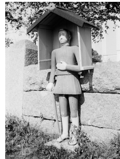
1911 1095883