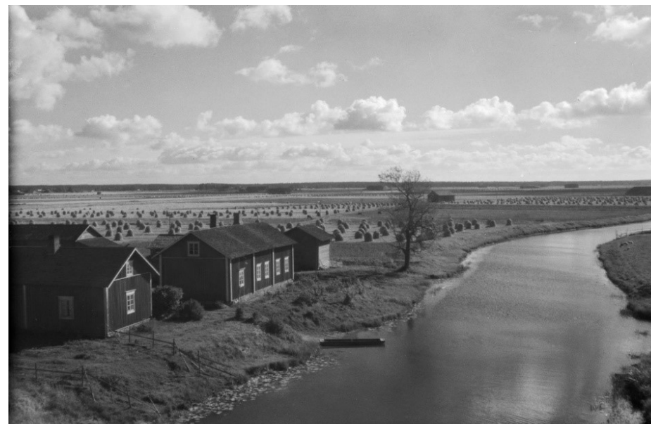
Eurajoen heinäpeltoja, Museoviraston kokoelmat, valokuvaaja Poutvaara Matti.