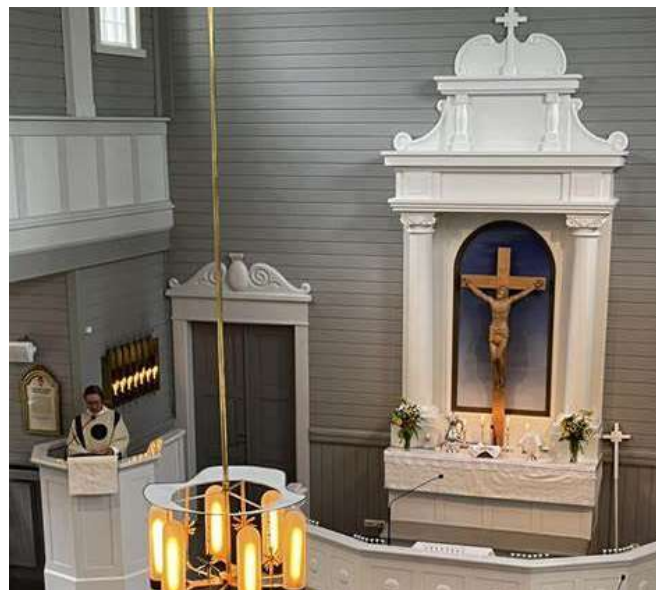
Sammaljoen kirkon alttarialue. Ilmari Launis 1924. Kirkkotilan seinäpanelointi on liki identtinen vuotta myöhemmin suunnitellun Kustaa Aadolfin kirkon seinäpaneloinnin kanssa.

Ilmari Launis maalasi myös alttaritauluja ja lasimaalauksia, varsinkin nuorena arkkitehtina. Hän maalasi mm. Luvian kirkon alttaritaulun vuonna 1912.