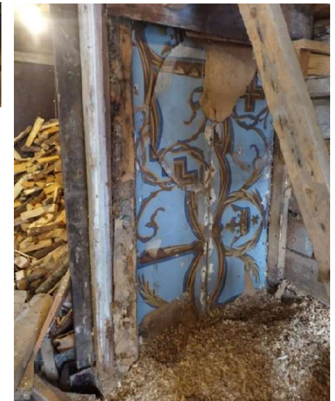
Oikealla: Julkisten etsintäkuulutusten myötä 2023 löytyi suuri määrä vanhan ulkorakennuksen rakenteissa säilyneitä friisin palasia. Näin saatiin talteen myös kruunukuvia.