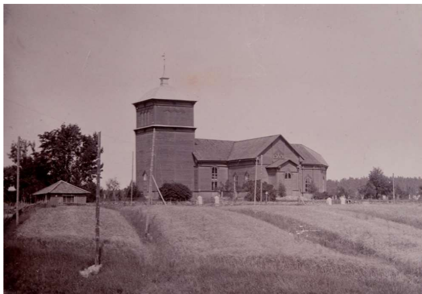
Kirkko kuvattuna etelästä: 1896, Finnan valokuva-arkisto, Museovirasto, historian kuvakokoelma.