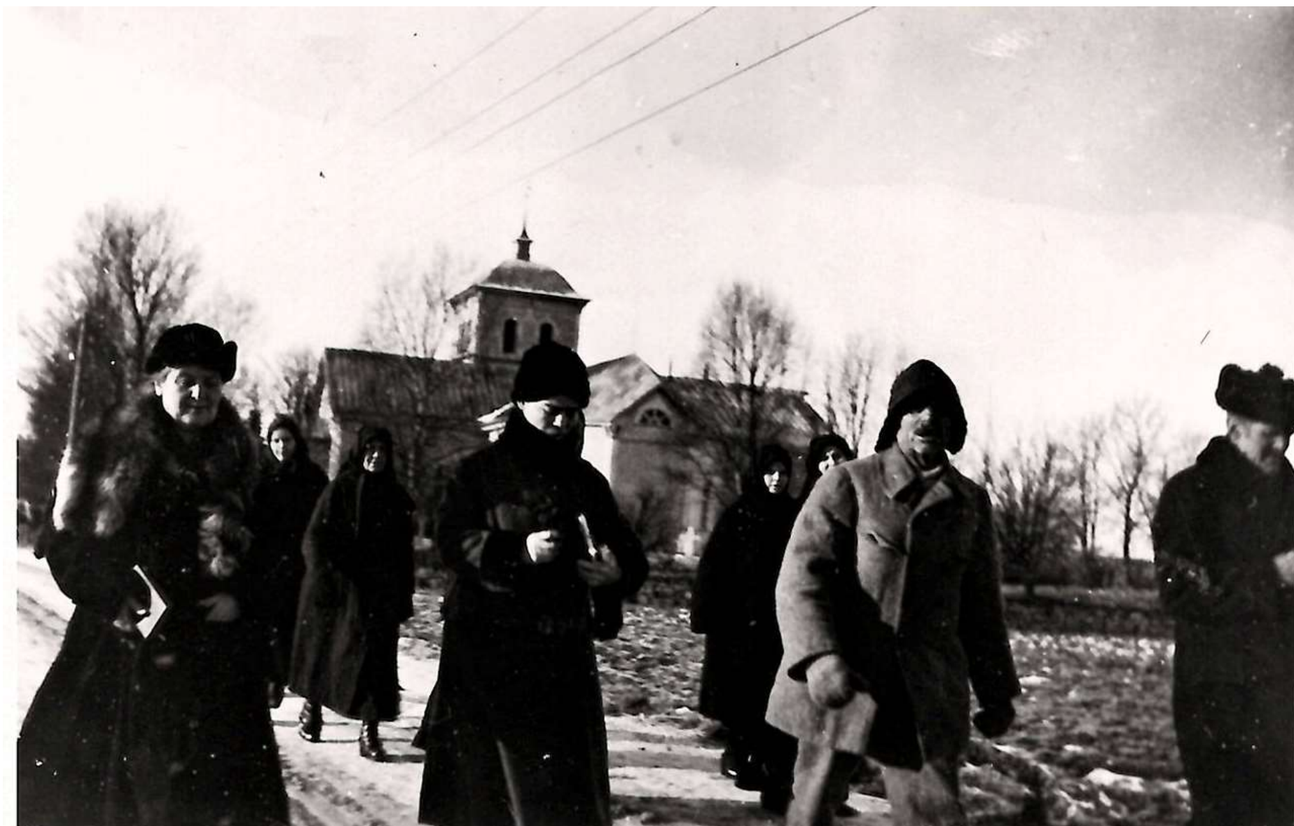
Kirkkokansaa vuonna 1925.