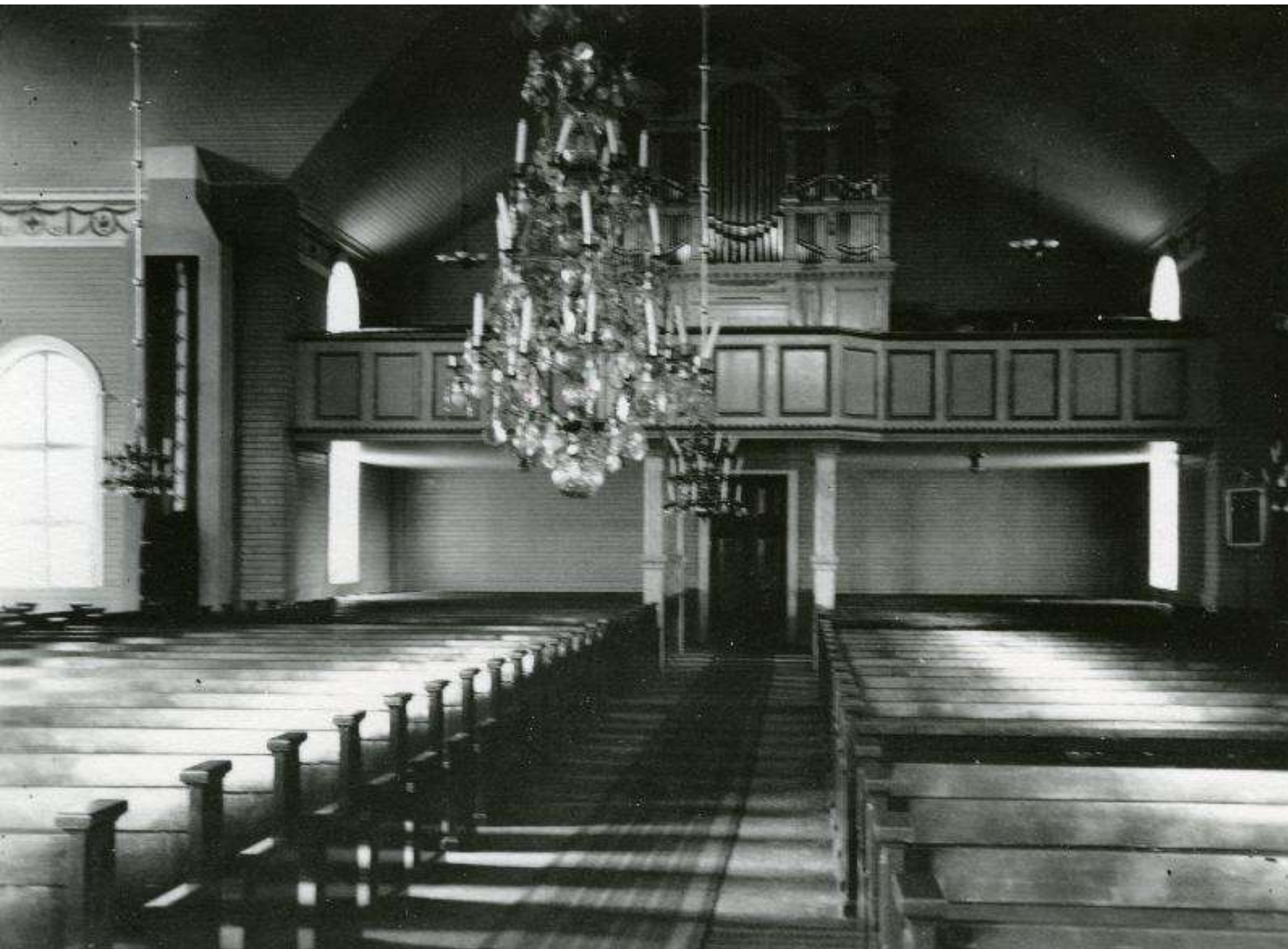
Valokuva Kustaa Aadolfin kirkon urkuparvelle. Kuvassa näkyvät urut ovat kirkon toiset, nykyisiä edeltävät urut. Pilarit ovat järjestyksessä kolmannessa asussaan, marmoroidut. Seurakuntain keskinäinen palovakuutusyhtiö 1930 Elka.