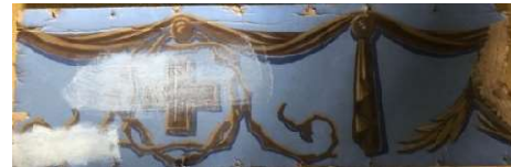
Vasemmalla: Kirkon arkistossa säilynyt friisikatkelma. Takana teksti, jossa kerrotaan mm. friisi poistetun vuonna 1964. Kirkossa säilyneessä palassa oli vain risti, ei koko kuviota.

Friisi poistettiin 1964, joten se ei ennättänyt olla kirkossa kuin vajaat neljä vuosikymmentä. Se on kuitenkin säilynyt vahvana seurakuntalaisten muistoissa.