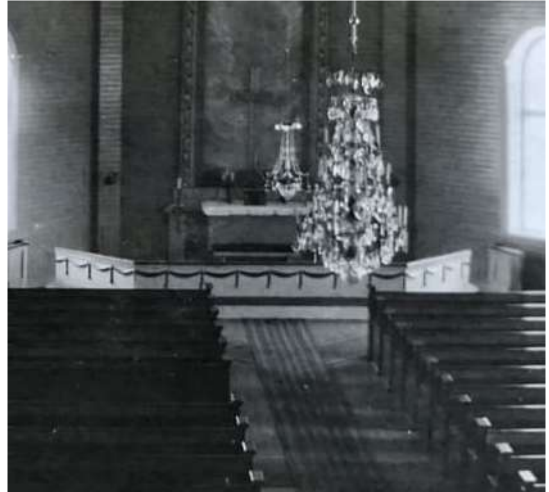
Vasemmalla kuva kohti kirkon alttaria ennen vuotta 1925. Oikealla kuva kohti alttaria vuoden 1925 muutosten jälkeen. Ilmari Launis ei muuttanut alttarin aluetta muutoin, paitsi värikyksen osalta. Vasemmalla Penkit uusittiin ja niiden suuntausta muutettiin 1925 korjaustöiden yhteydessä.